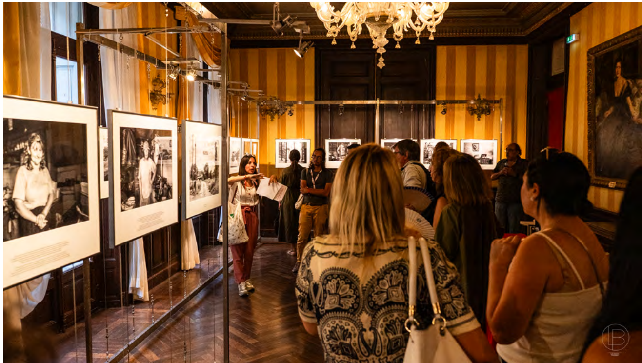
© Lou BARON Visites privées à l'hôtel PAMS