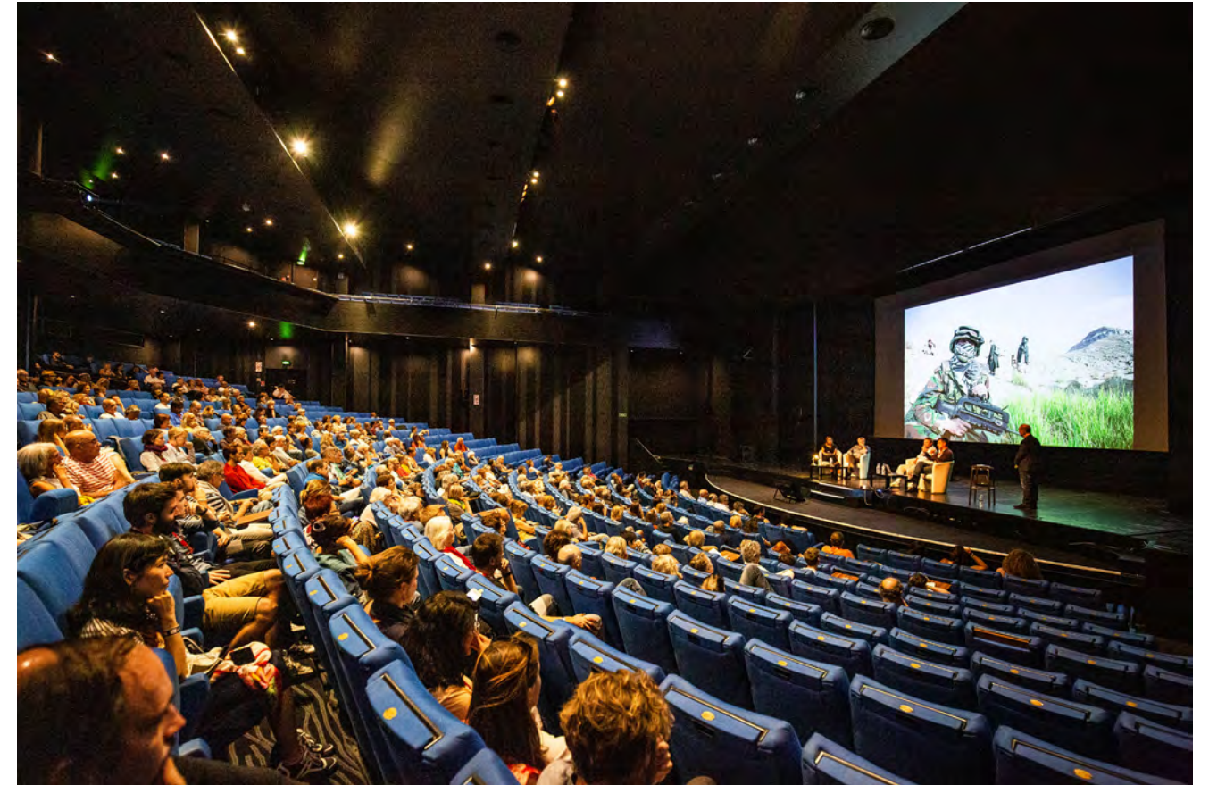
Conférence au Palais des Congrès

Cette déduction fiscale vous permet de soutenir activement la promotion de l'art photographique ainsi que les actions sociales de Visa pour l'Image tout en réduisant votre charge fiscale. Vous contribuez à un enrichissement culturel et à la valorisation de talents exceptionnels.