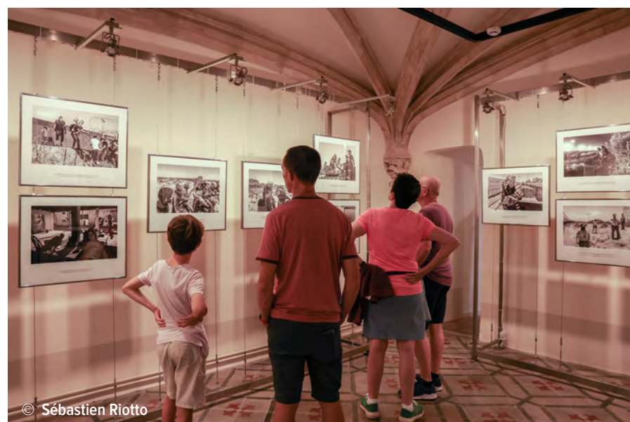
LA CASA XANXO