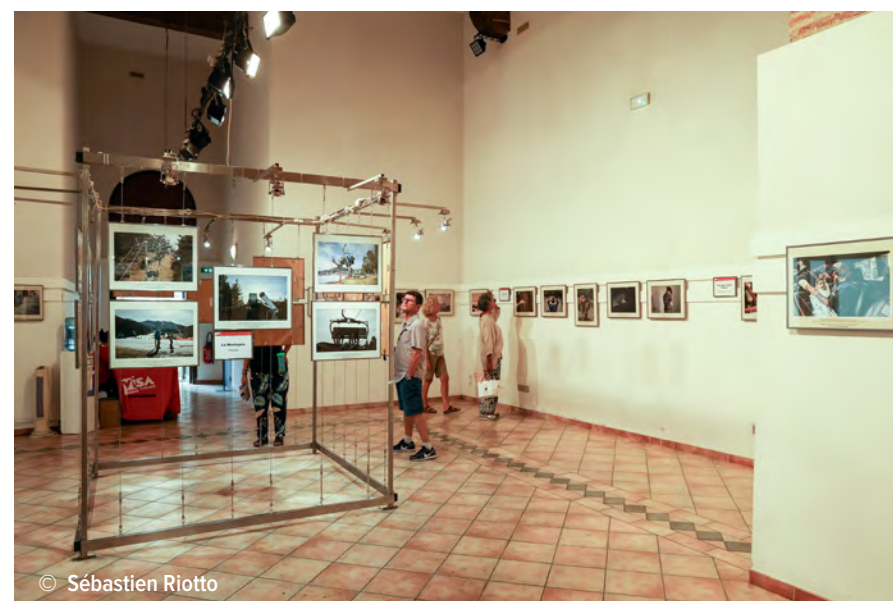
LA CASERNE GALLIENI