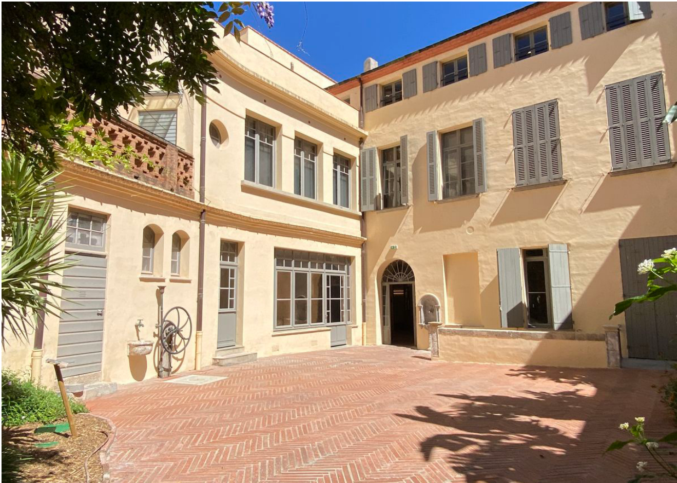
© Lou BARON La Casa Xanxo