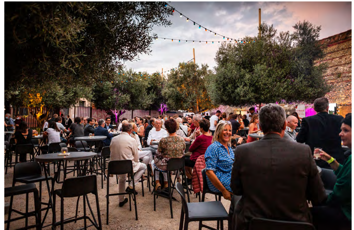
Espace partenaires du festival Visa pour l'Image - Perpignan