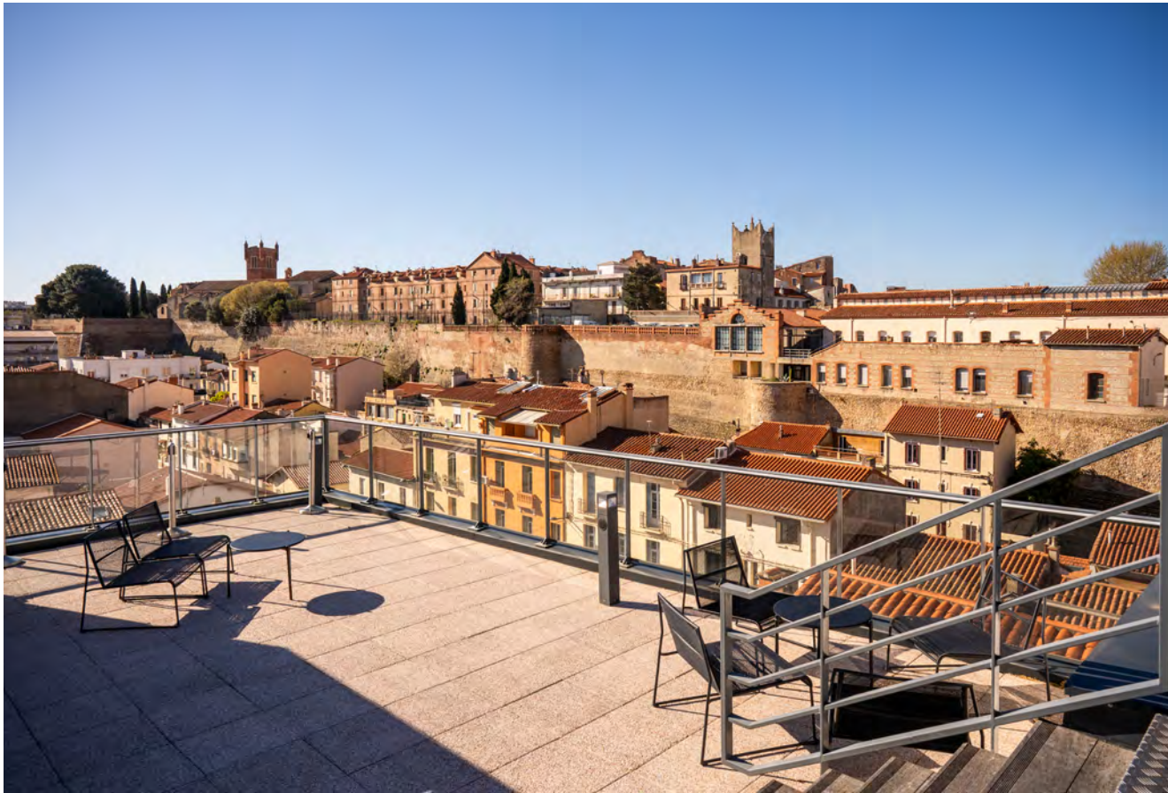
Rooftop du Dali Hôtel