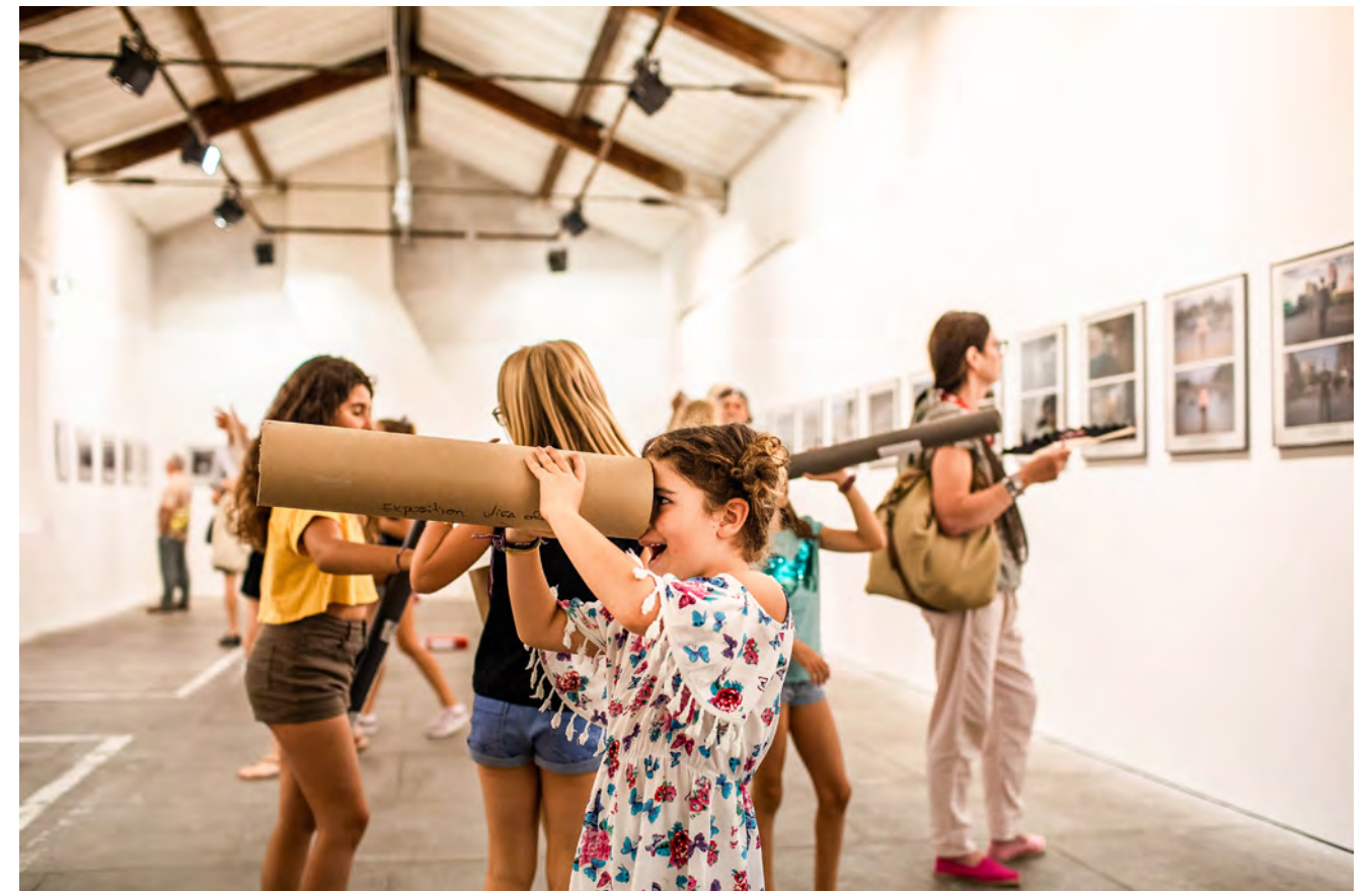
Atelier d'éducation à l'image -du Festival Visa pour l'Image - Perpignan