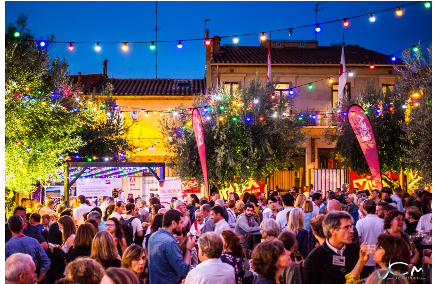
Espace partenaires du festival Visa pour l'Image - Perpignan

Tout au long de l'année, vous serez invités à des rendez-vous privilégiés pour échanger avec l'équipe de l'association Visa pour l'Image - Perpignan sur la vie et la programmation de ce lieu culturel.