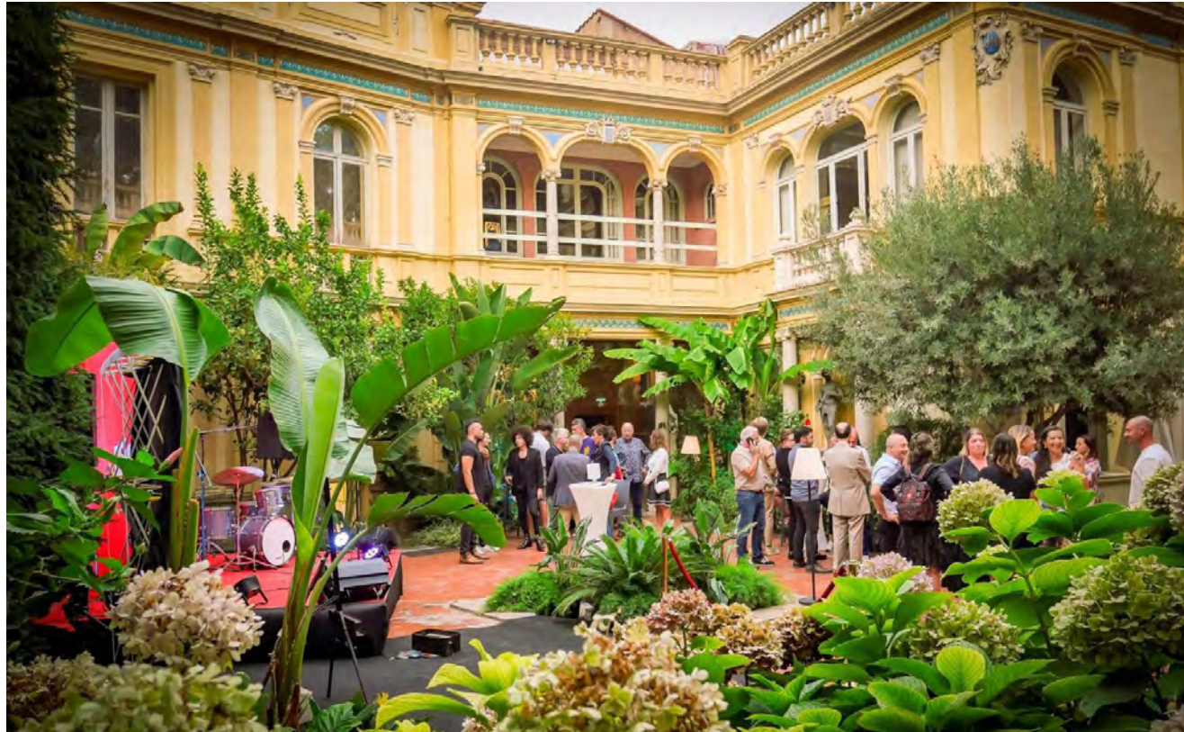
Soirées privées à l'hôtel PAMS

L'association Visa pour l'Image – Perpignan organise des soirées privées pour son club de mécènes, les deux premières semaines du Festival Visa pour l'Image dans les plus beaux lieux de Perpignan.