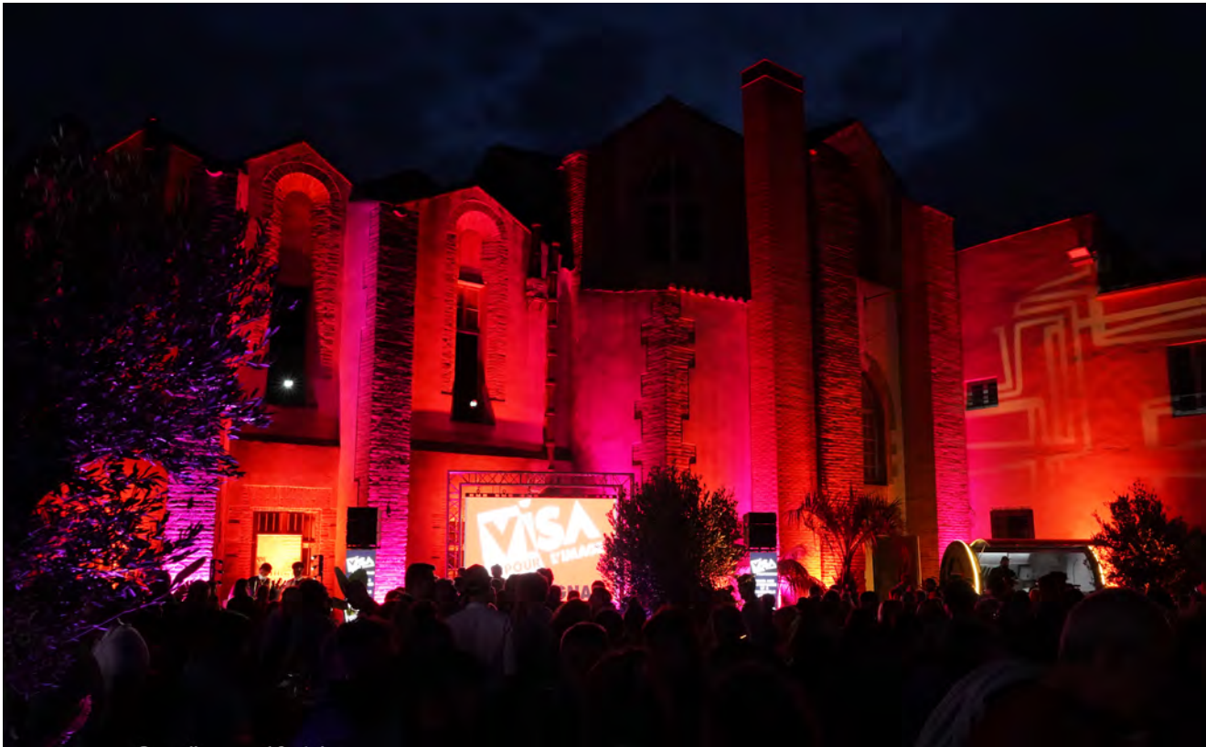
© Caroline MOREL-FONTAINE Espace partenaires du festival Visa pour l'Image - Perpignan